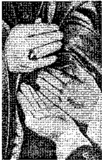
Amiket megáldanak áldottak legyenek

Egy párbeszéddel kezdenék, amit egy lelkigyakorlaton hallottam egy paptól, akitől megkérdeztük, hogy miért lett pap: