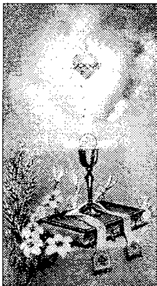
Te pap vagy mindörökké!

A papszentelés ünnep az Egyháznak, ünnep annak az Egyházközségnek, ahonnan a felszentelt pap elindult, és ünnep annak a fiatalembernek és családjának, akit a püspöke pappá szentelt. E gondolatok jegyében nézzük a pap feladatát, és azt: hogyan gondolkodnak az emberek a papról.