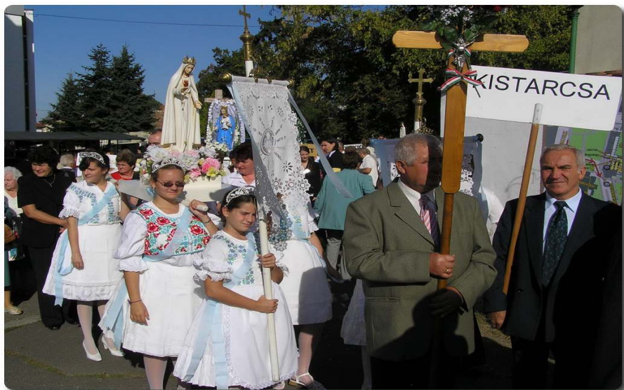
A képek Gyöngyösön, a Mária-szobrok találkozásánál készültek