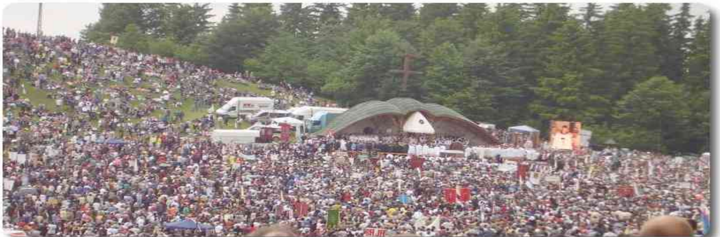
Csíksomlyó, pünkösdi búcsú szentmise a somlyói nyeregben