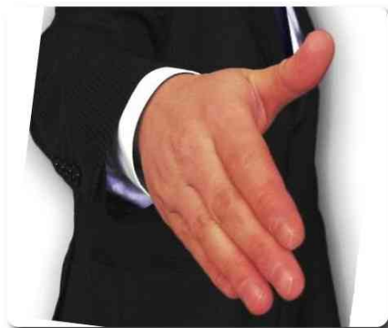
Béke veled! És a Te lelkeddel!

ugyanannyi órán át dolgoztak, mégis egyformán kaptak bért. És egyszer csak eloszlott minden kétségem. Aztán amikor elérkeztünk a kézfogáshoz barátságos, nyílt tekintetek találkoztak az enyémmel.