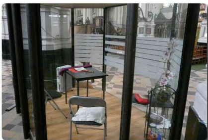
Modern gyóntatófülke Brüsszelben

Egyik szombat este kicsit korábban érkeztem a misére. Szokott helyemen már ültek, két teljes sorban és az előttük lévő pad két szélén. Én ebbe a padba ültem be középre. A csoportról első látásra kiderült, hogy összetartoznak, nem rendszeres templomba járók és gyászmisére jöttek. Ez később is világosan látszott, nem tudták, mikor kell felállni, keresztetvetni, stb. Az jutott eszembe, hogy, ha ennyire nem ismerik a szentmise menetét, talán azt sem tudják, hogy mit jelent az, hogy Köszönsétek egymást a béke jelével! Nyújtsam nekik a kezem, vagy ezzel zavarba hozom őket? Ezután jött az evangélium. Ezen a napon éppen arról szólt, amikor szőlőmunkások nem