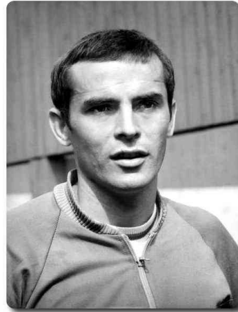
Balczó András 40 évesen