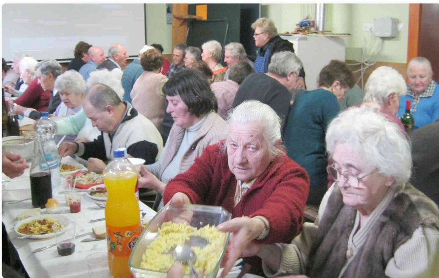
Szeretetvendégség a plébánián 60 év felettiek számára